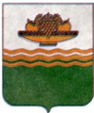
Схема теплоснабжения Муниципальное образование Табачненское сельское поселение Бахчисарайского района Республики Крым на 2016-2031 г.г.